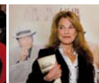
Tous droits réservés