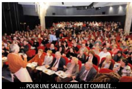
... POUR UNE SALLE COMBLE ET COMBLÉE...