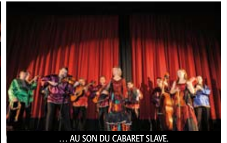
... AU SON DU CABARET SLAVE.