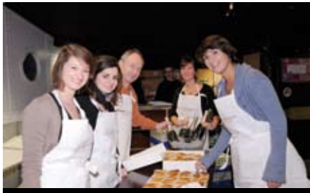
... ET UN SERVICE DE CHOC...