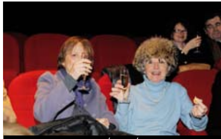
... POUR UN APÉRITIF PÉTILLANT...