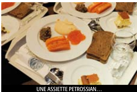
UNE ASSIETTE PETROSSIAN...