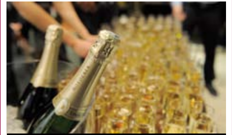
UN FLOT DE CHAMPAGNE ROEDERER...